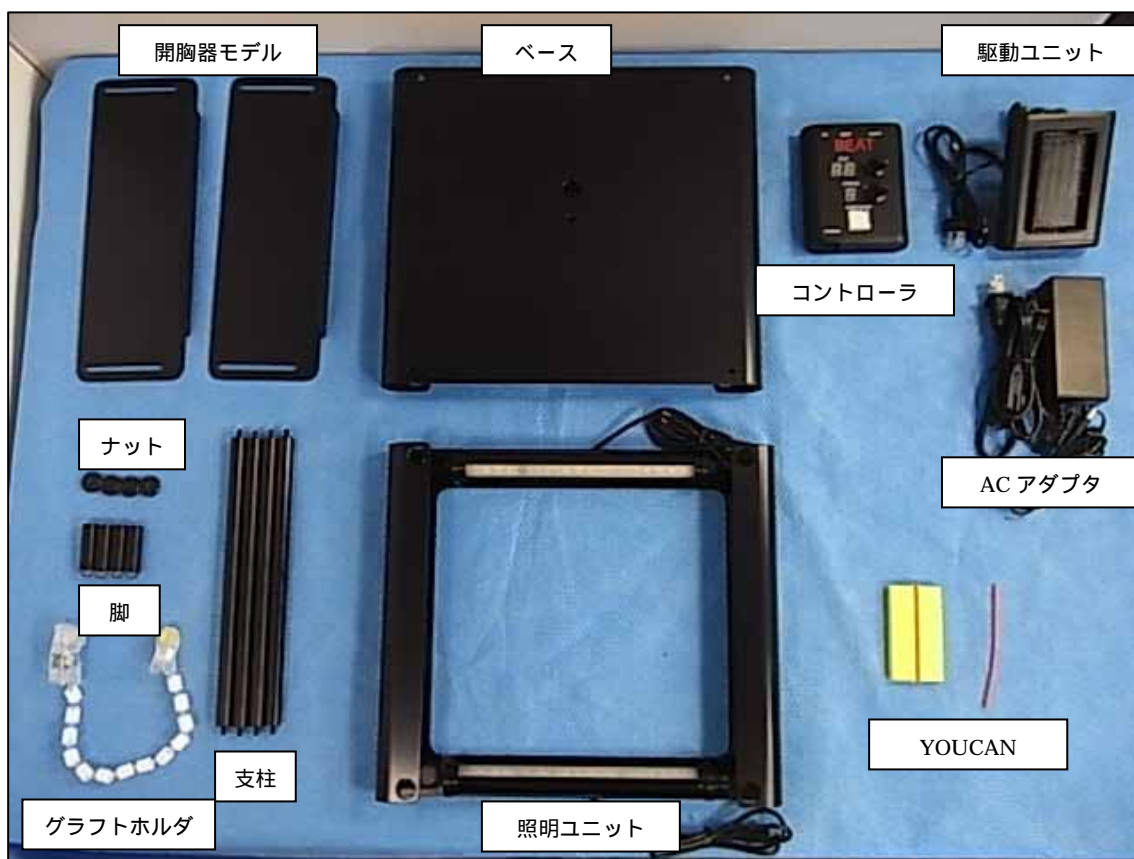
図1 BEAT-S1 の構成